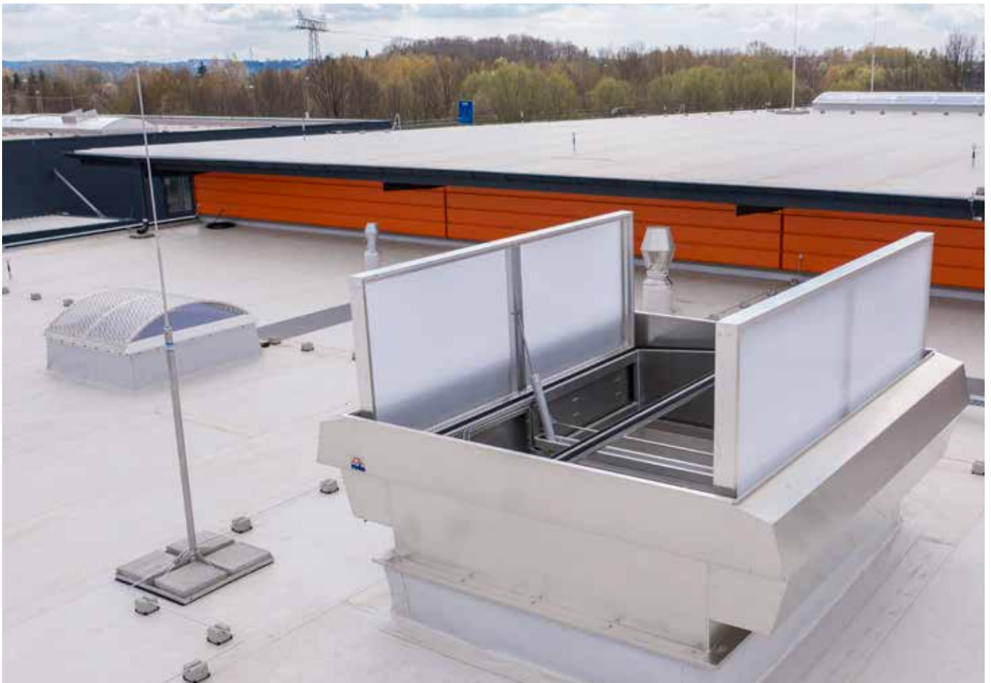
Doppelklappen Lüfter MEGAPHÖNIX neben LAMILUX Lichtkuppel F100 mit Laubbaumblech