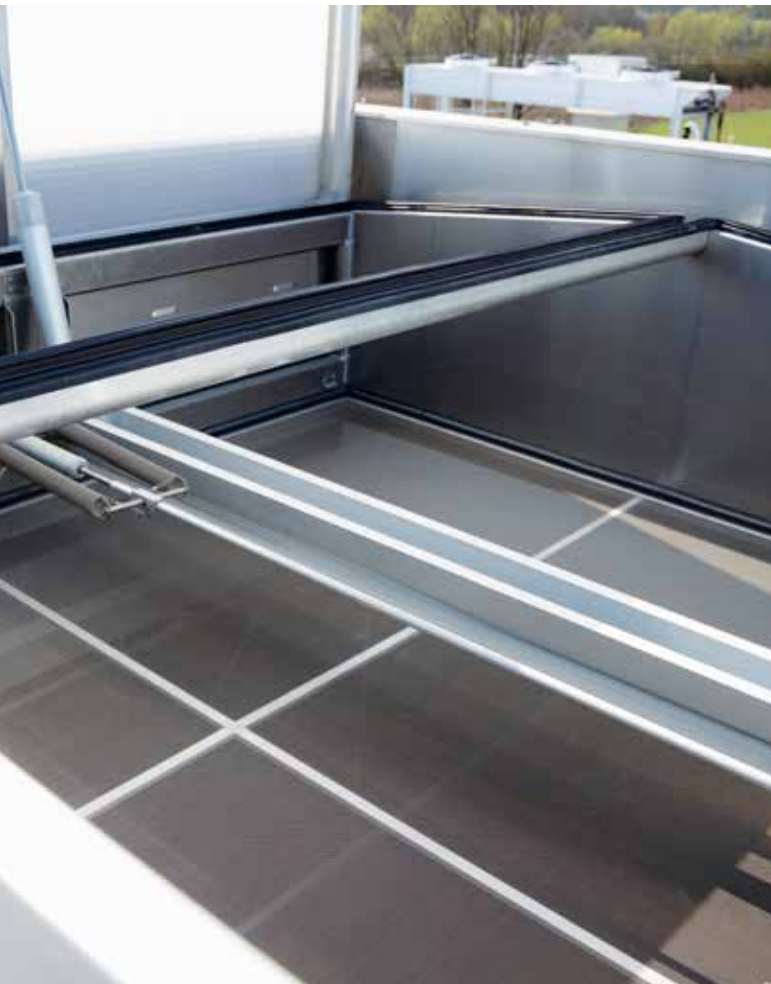
roda MEGAPHÖNIX mit Insektenschutzgitter