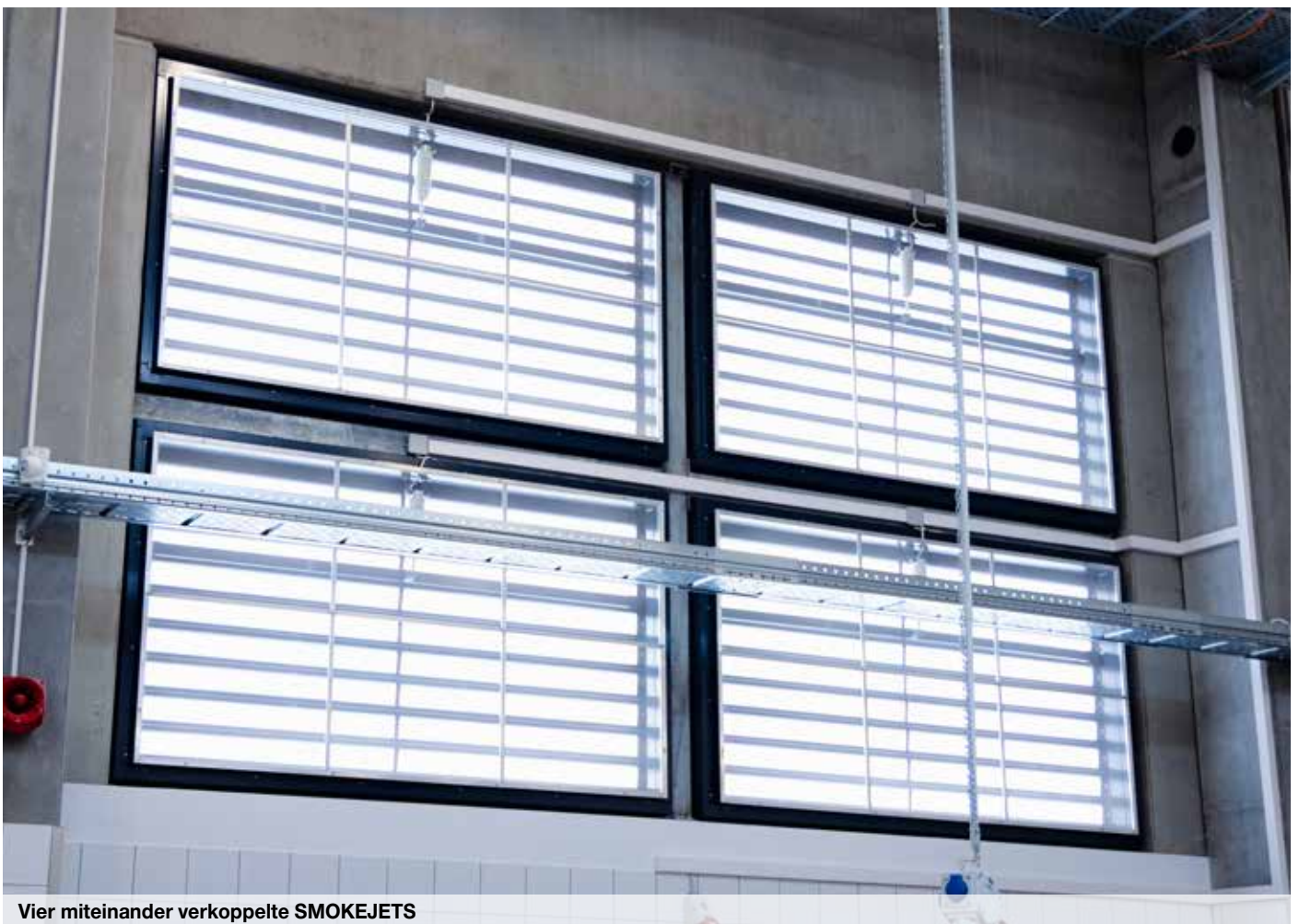
Vier miteinander verkoppelte SMOKEJETS