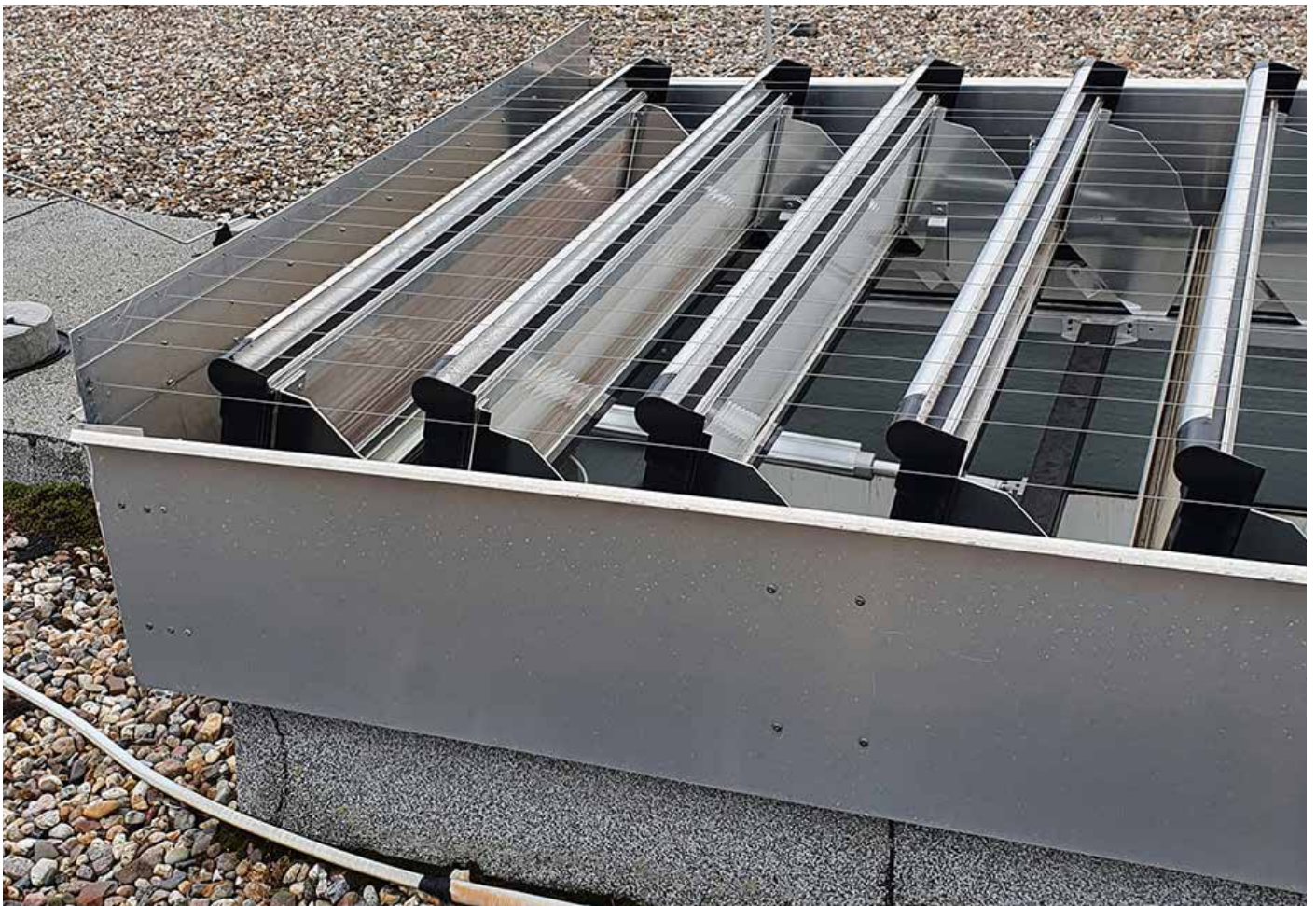
Vorher: Lamellen Lüfter