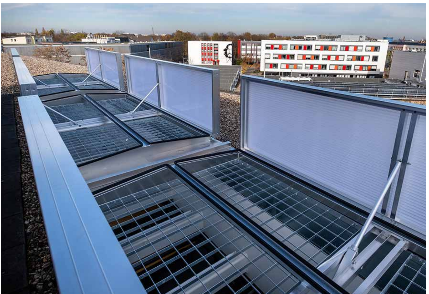
roda Lösung: Doppelklappen Lüfter Typ PHÖNIX