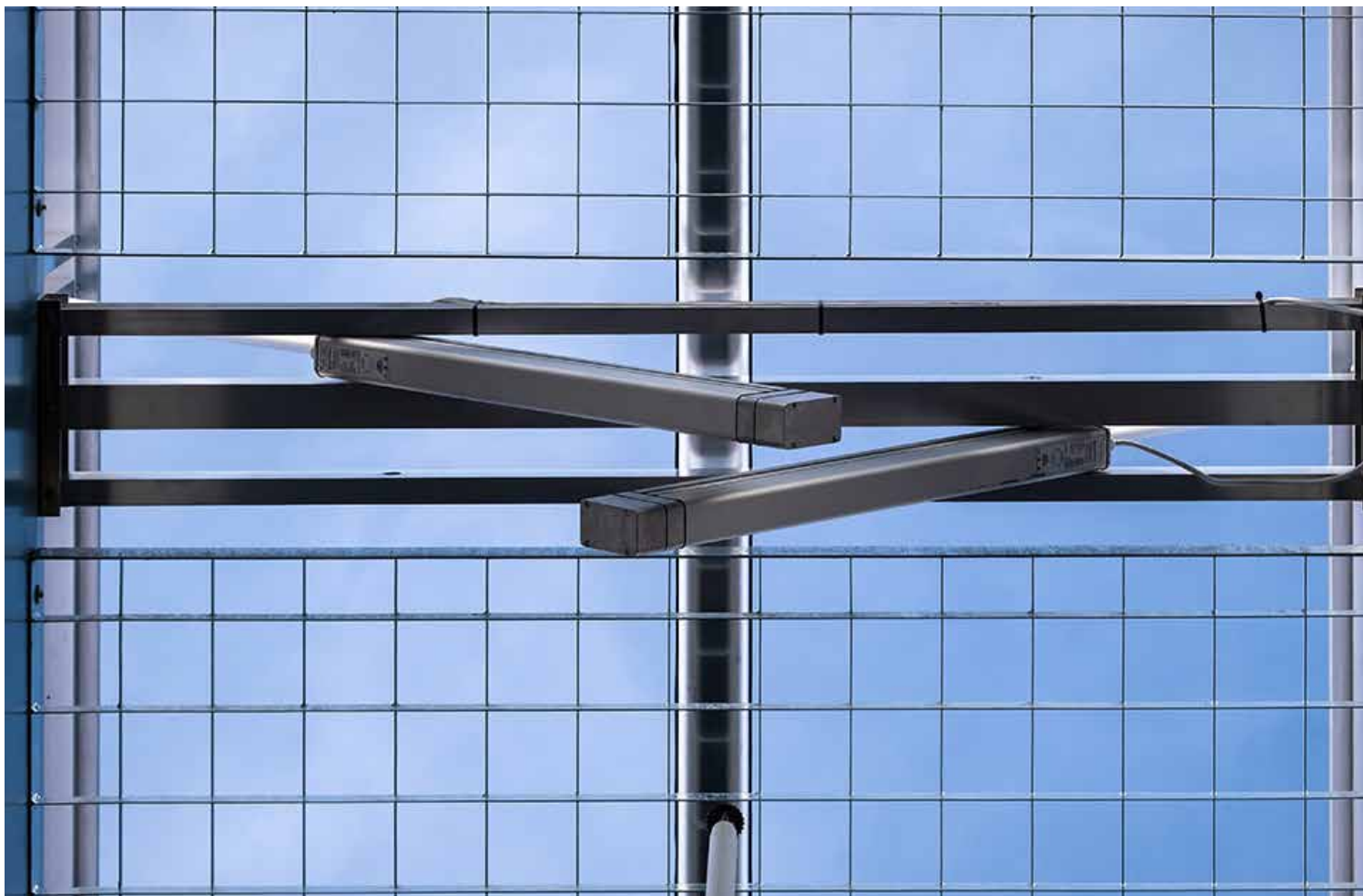
Absturzicherung durch Durchsturzgitter mit Maschenweite 100 x 100 mm

Mit 117 m 2 lichtdurchfluteter Gesamtfläche und einer Softlite Verglasung wird die Bibliothek blendfrei und bestmöglich mit Tageslicht ausgeleuchtet. Weiche Übergänge schaffen dabei die perfekte Lern- und Arbeitsatmosphäre. Die Verglasung besteht aus Polycarbonat-Mehrstegplatten mit der Hagelwiderstandsklasse HW5 der höchsten Hagelschutzklasse für Kunststoffverglasungen für Hagelkörner bis Hühnereigröße.