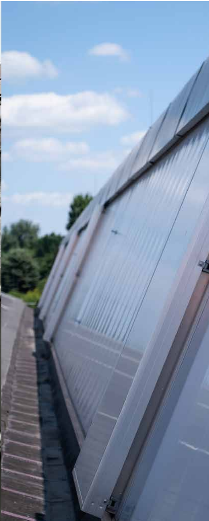
Sanierung eines Sheddachs