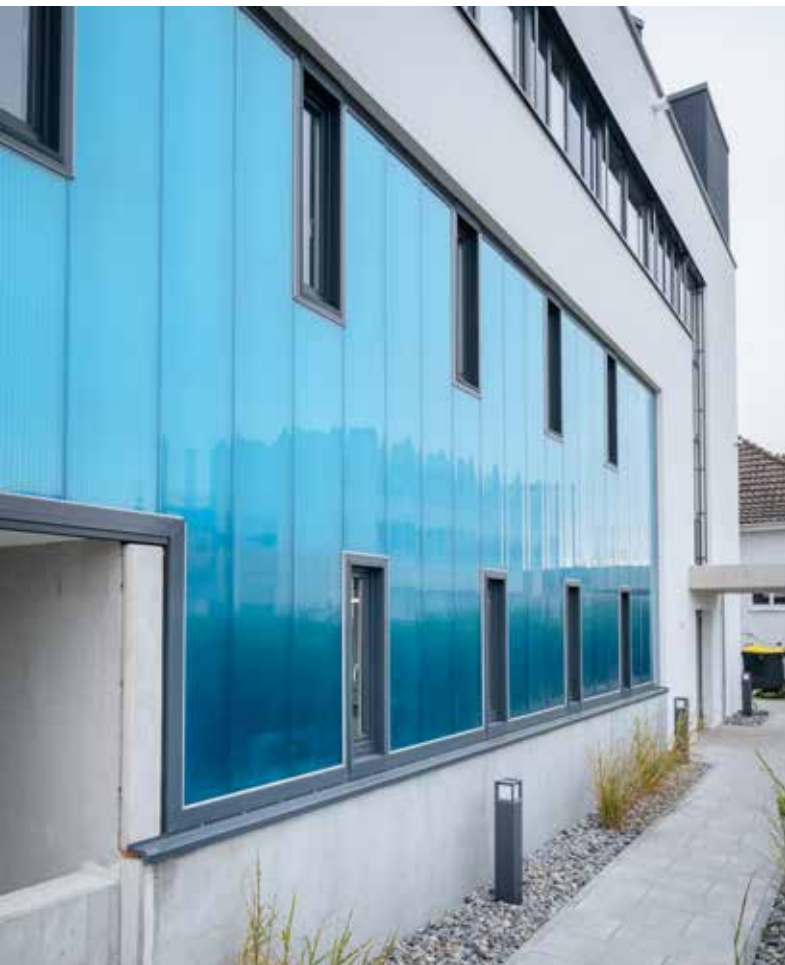
Nut- und Federsystem eingebaut in der Fassade