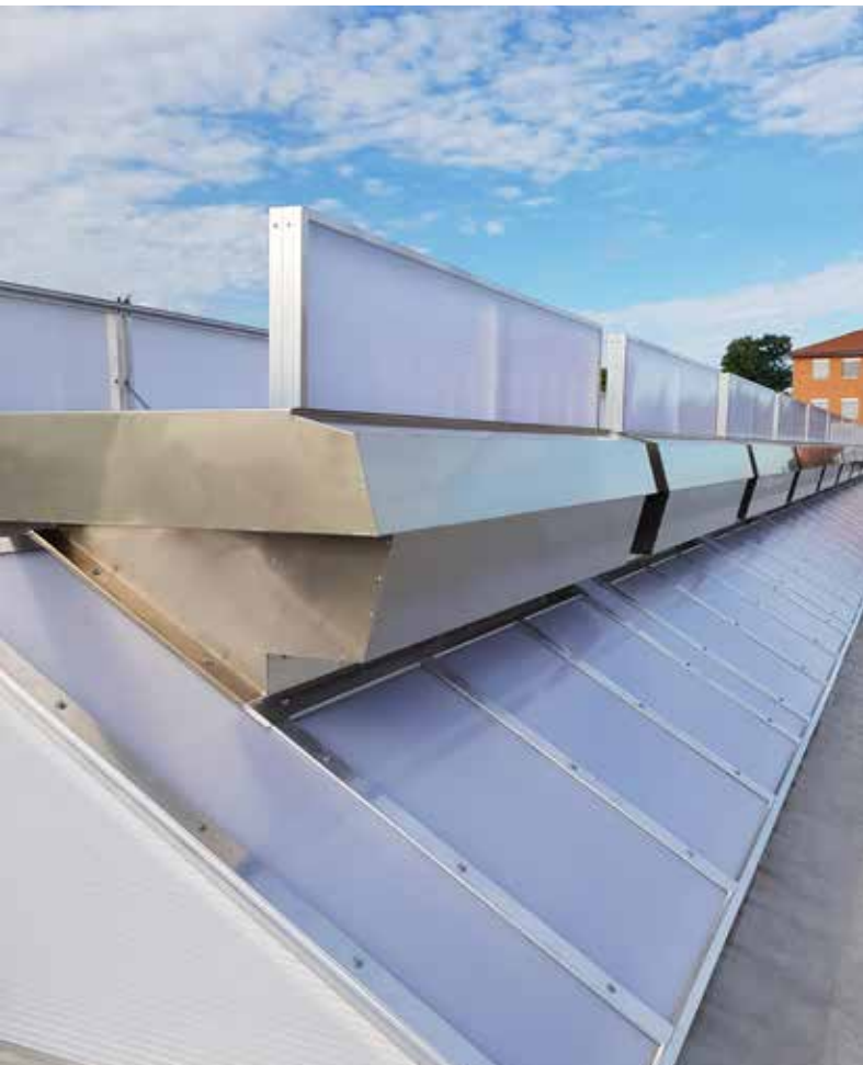
Satteldach-Lichtband mit verbauten Mehrzwecklüftern MEGAPHÖNIX