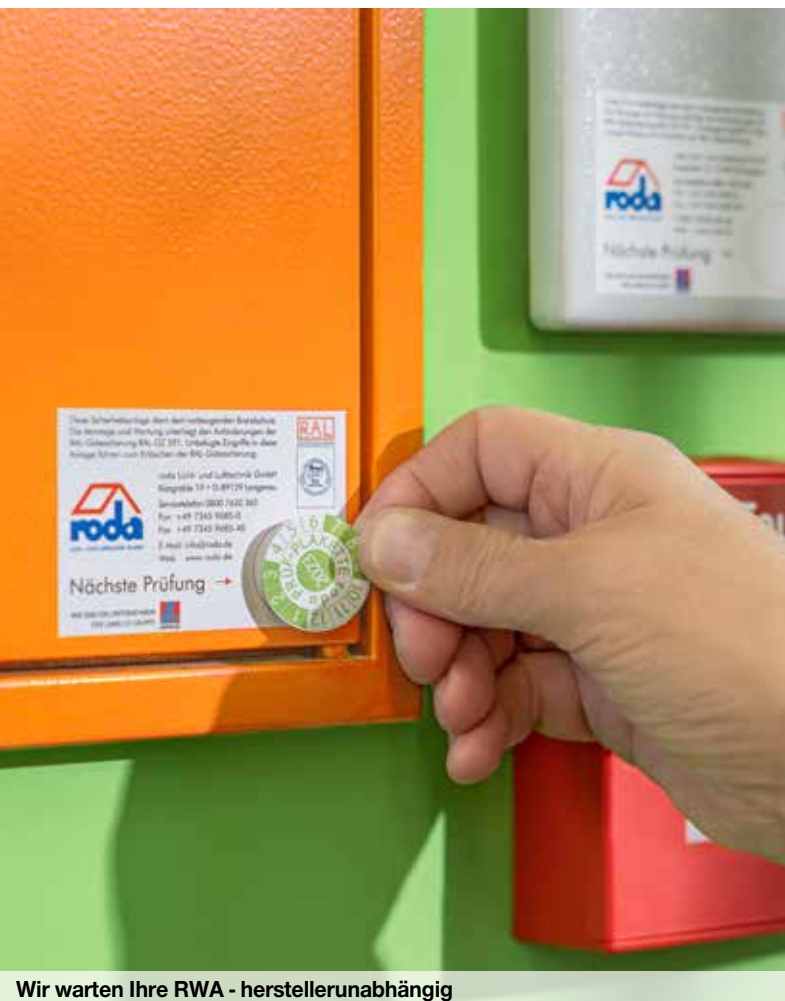
Wir warten Ihre RWA - herstellerunabhängig