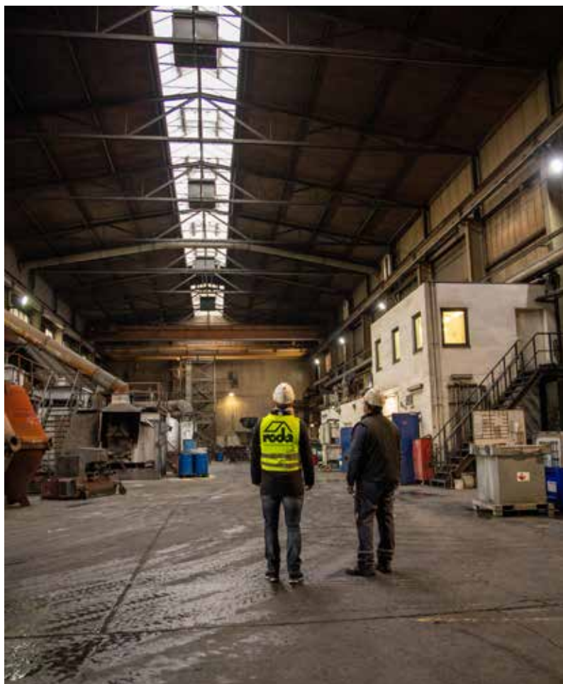
Sanierungskonzepte – auch bei laufendem Produktionsbetrieb