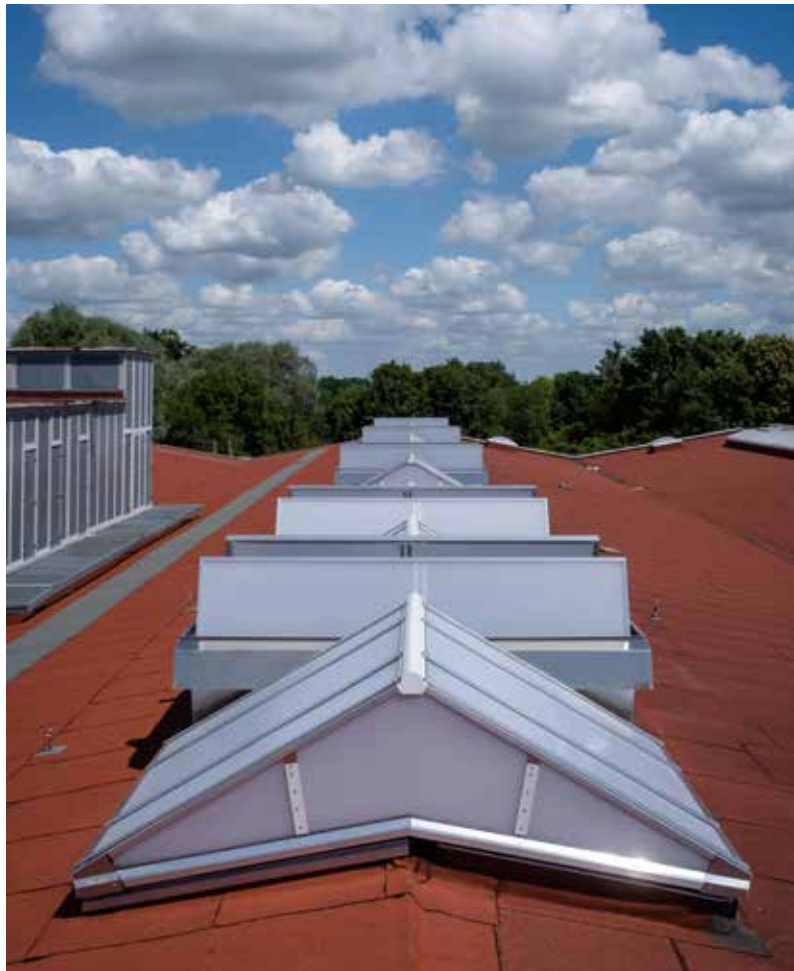
Lichtband Satteldach mit Mehrzwecklüfter MEGAPHÖNIX