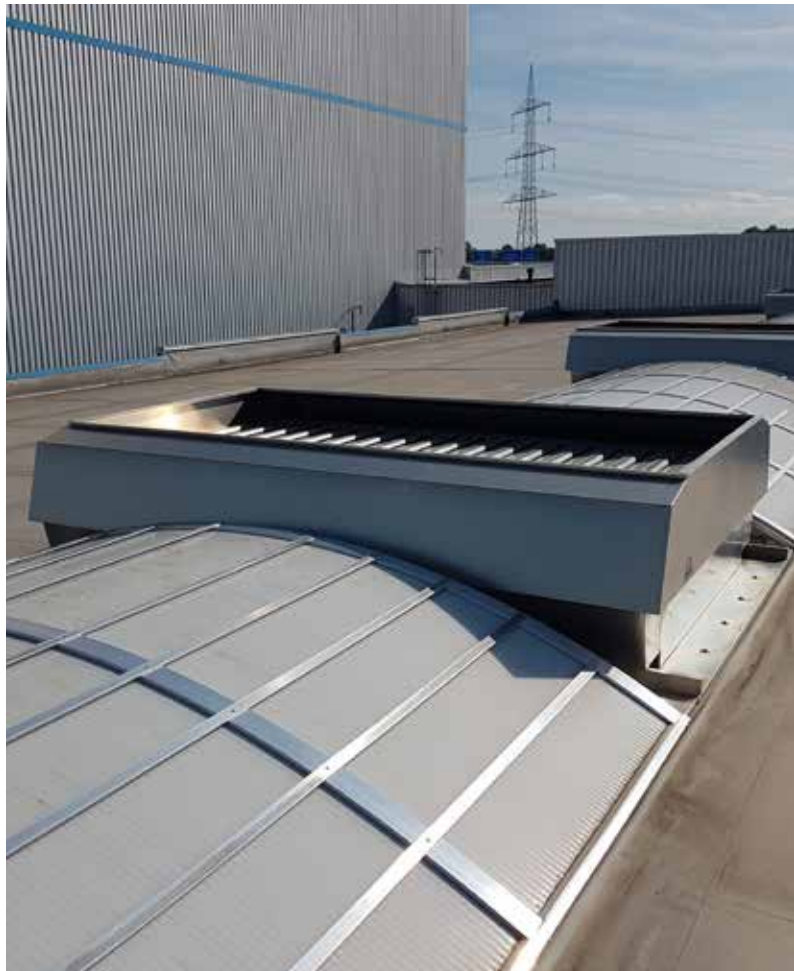
Mehrzwecklüfter MULTIJET in Lichtband Bogenform