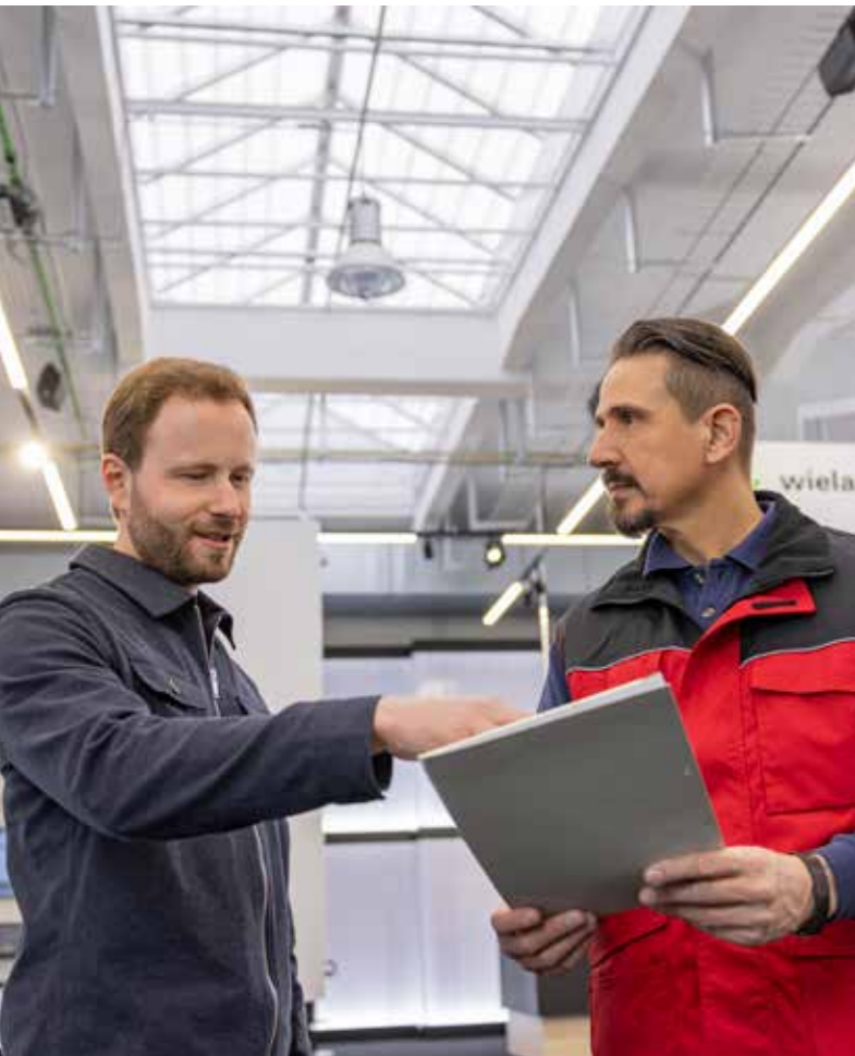
Wir finden für Sie die bestmögliche Lösung