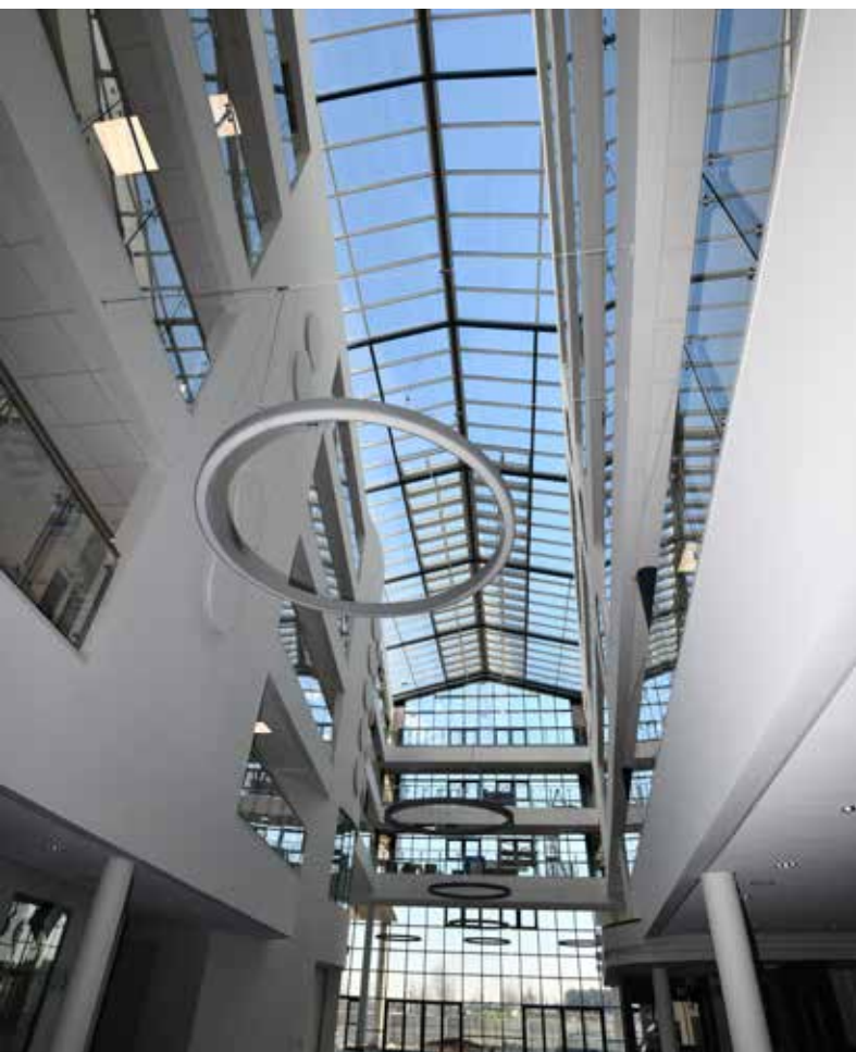
Doppelklappenlüfter FIREFIGHTER eingebaut in einer Glasdach Konstruktion