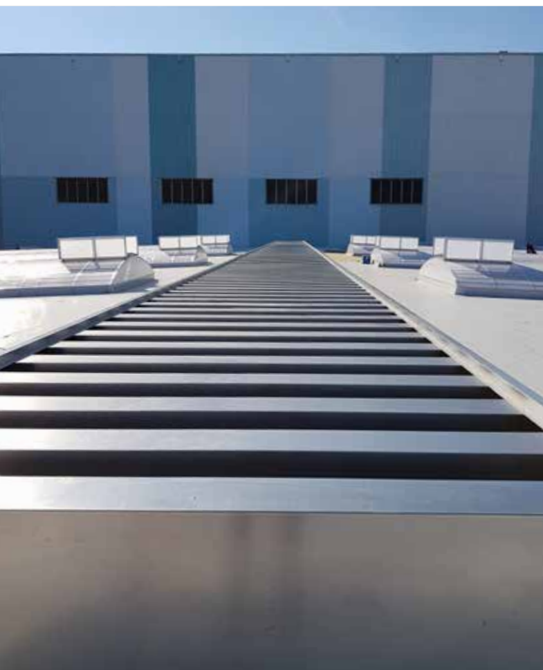
Labyrinth Lüfter AIRSTAR