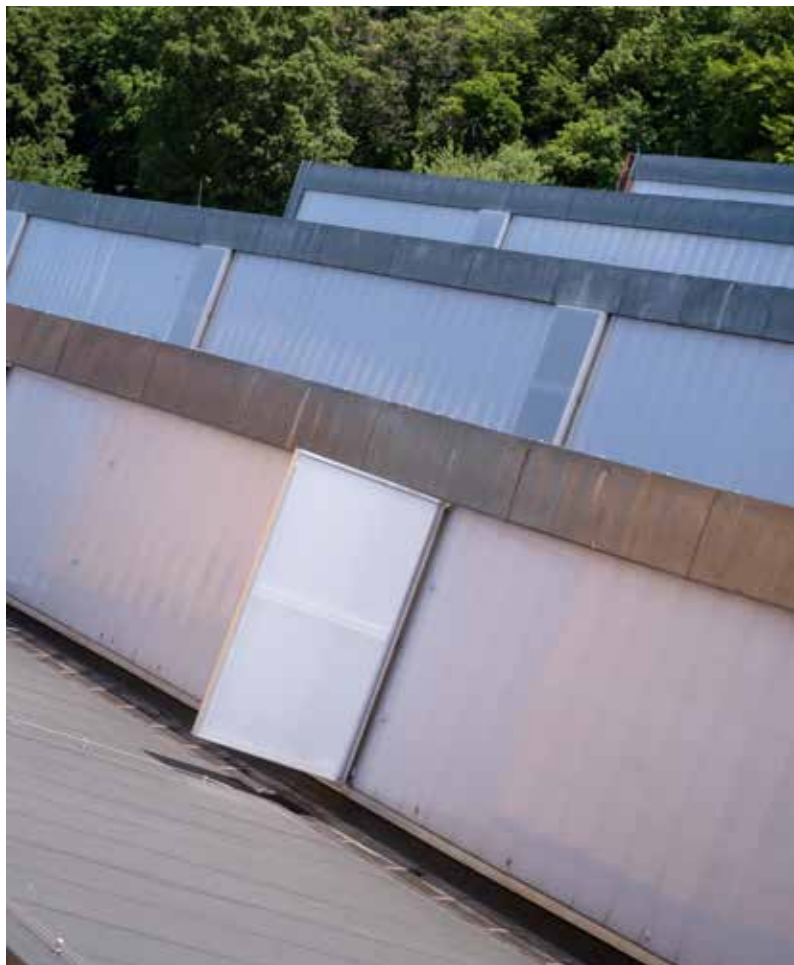
Sanierung eines Sheddachs mit Nut- und Federsystem