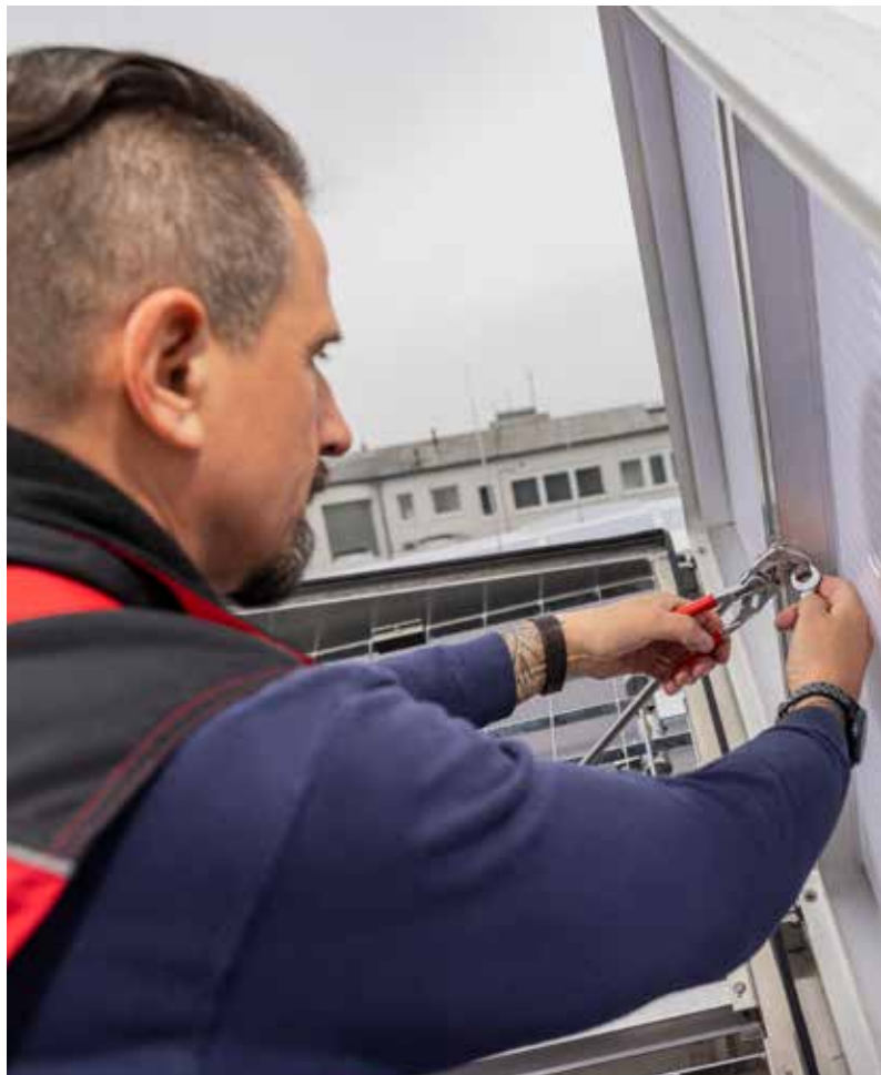
roda ist ein VdS-anerkannter Konstrukteur