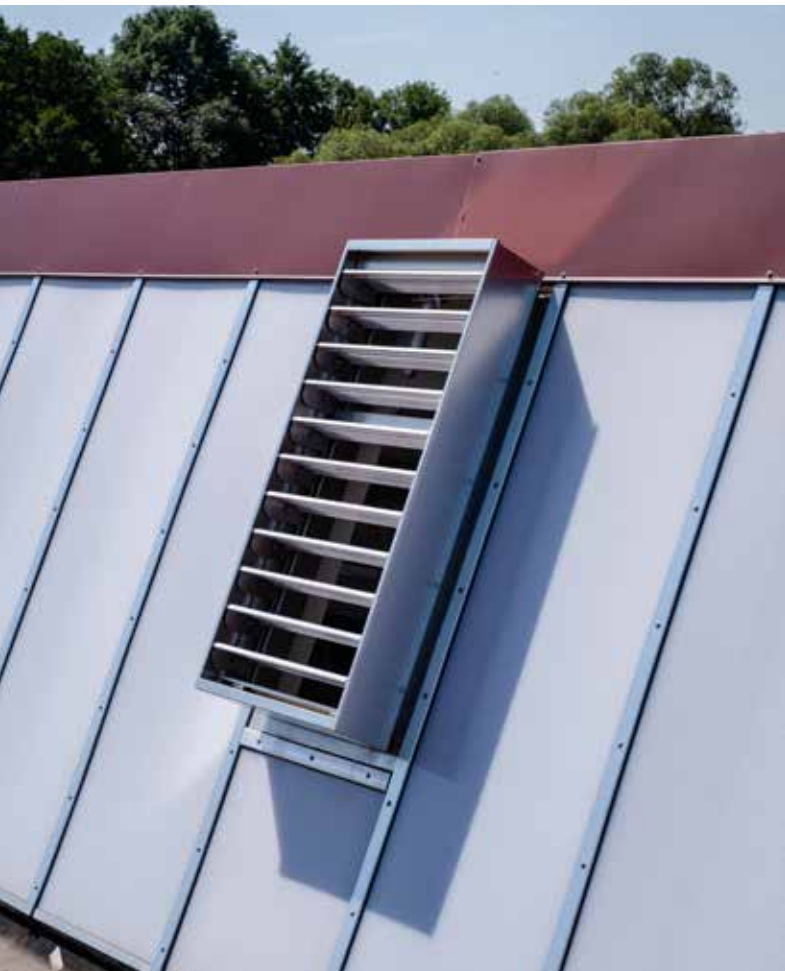
Lamellenlüfter SMOKEJET in einer Sheddachkonstruktion