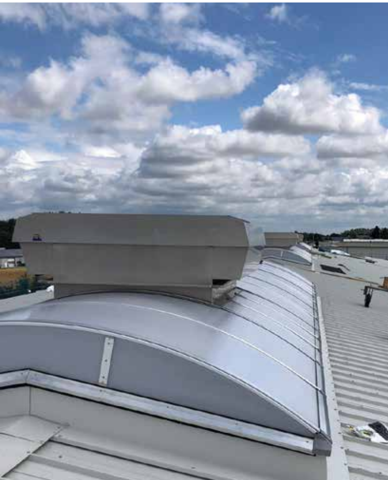
Lichtband Bogenform mit einem Mehrzwecklüfter MEGAPHÖNIX auf Rodeoflansch